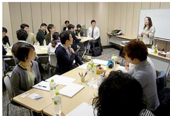
講座の様子(左:オンラインセミナー、右:リアルセミナー)